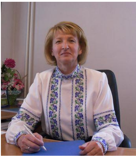
ДЕКАН ІНСТИТУТУ ЕКОНОМІКИ ТА МЕНЕДЖМЕНТУ

43025, м. Луцьк, вул. Винниченка, 28 (Корпус G)